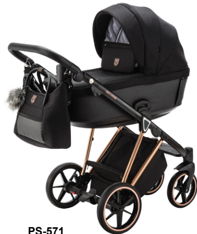
PS-571 special edition