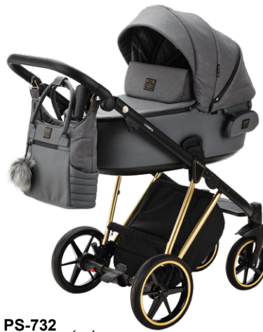
PS-732 special edition