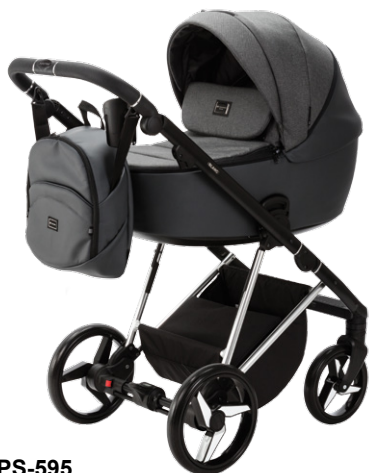
PS-595 special edition