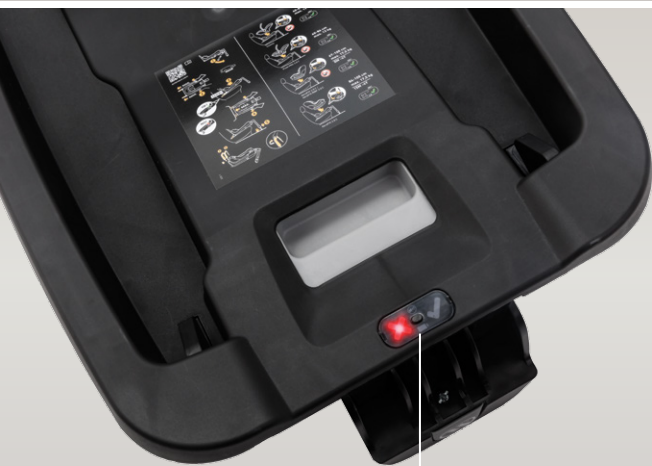
sygnalizacja wpięcia fotelika