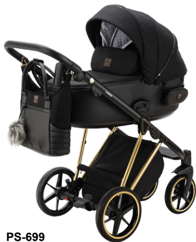
PS-699 special edition