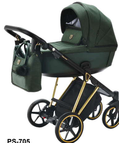
PS-705 special edition