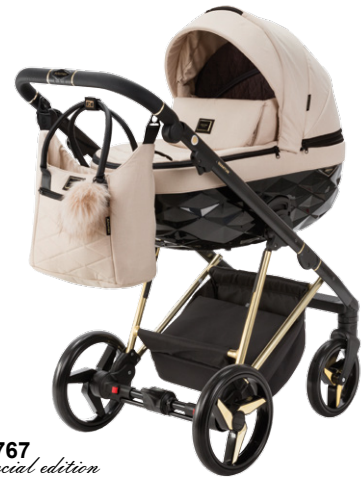
TK-767 special edition