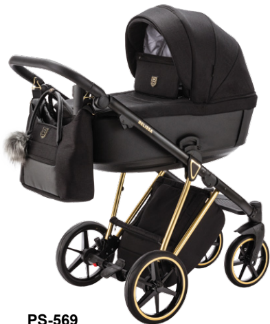
PS-569 special edition