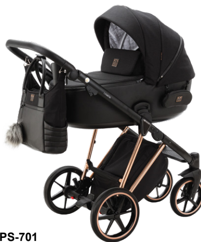
PS-701 special edition