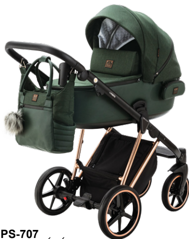
PS-707 special edition