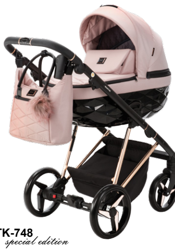
TK-748 special edition