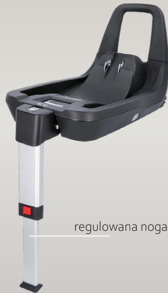
regulowana noga podpierająca