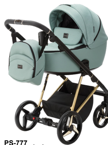
PS-777 special edition