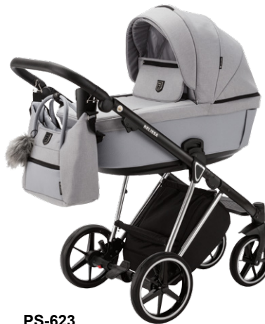
PS-623 special edition