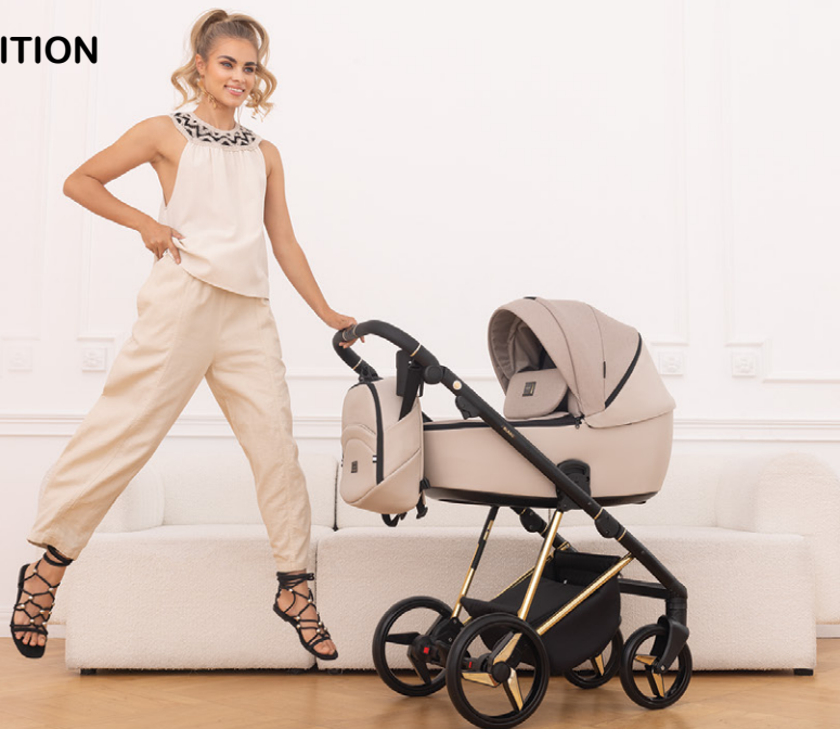
PS-532 special edition