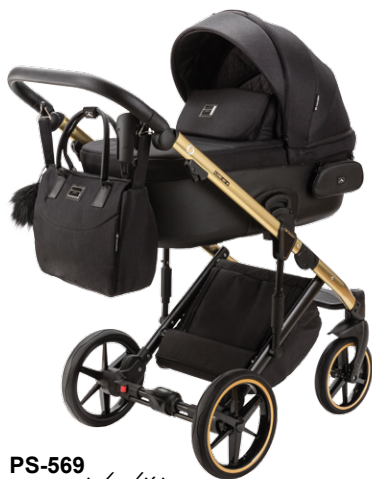
PS-569 special edition