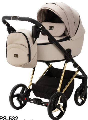
PS-532 special edition