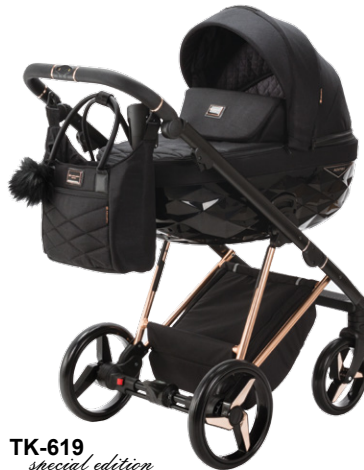
TK-619 special edition