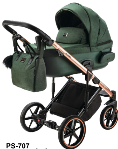
PS-707 special edition