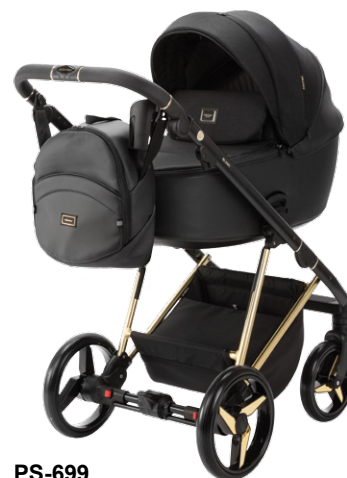
PS-699 special edition