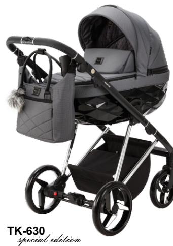
TK-630 special edition