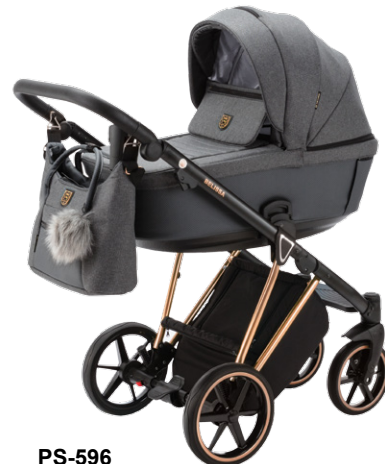
PS-596 special edition