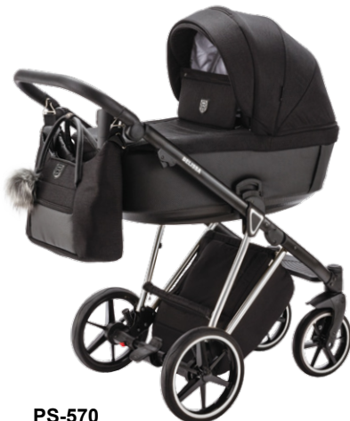
PS-570 special edition