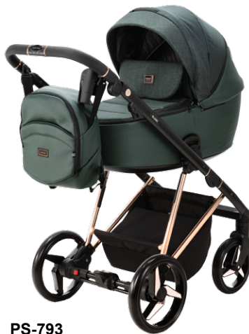
PS-793 special edition