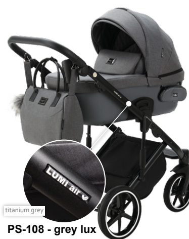
PS-108 - grey lux