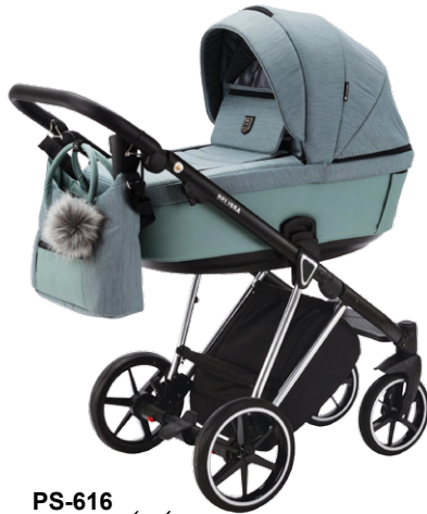
PS-616 special edition