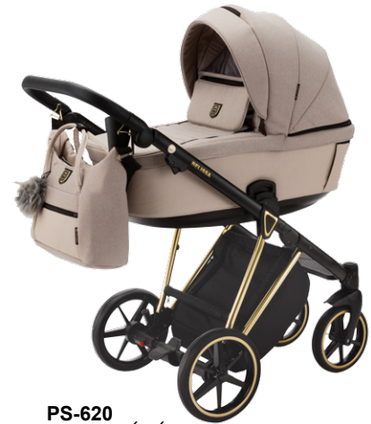
PS-620 special edition