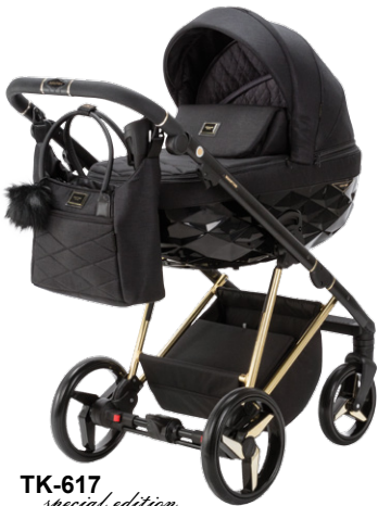
TK-617 special edition