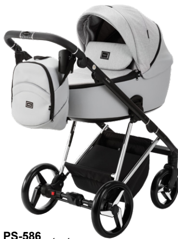
PS-586 special edition