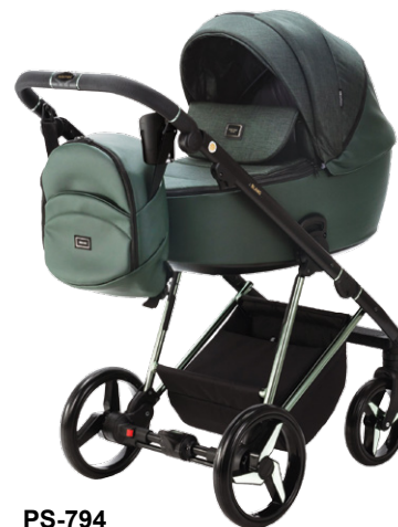
PS-794 special edition