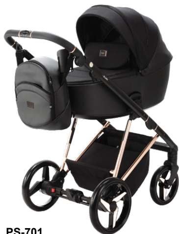
PS-701 special edition