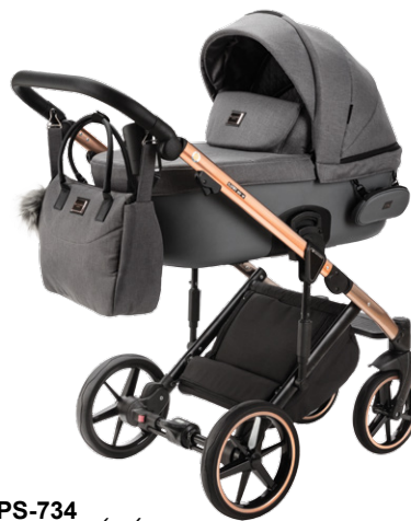
PS-734 special edition