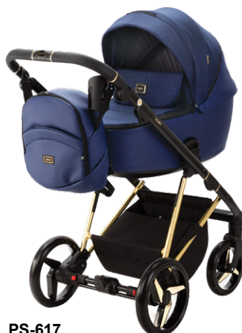
PS-617 special edition