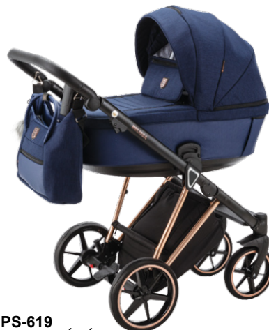
PS-619 special edition