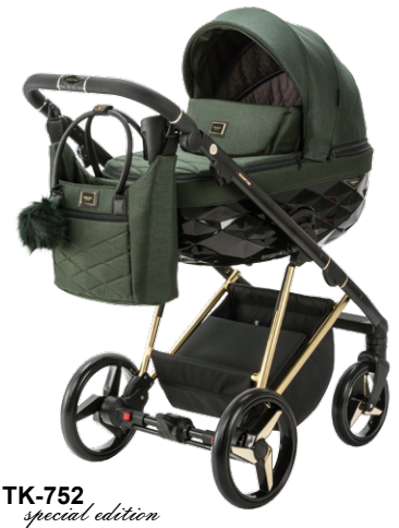
TK-752 special edition