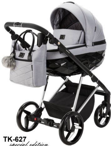
TK-627 special edition