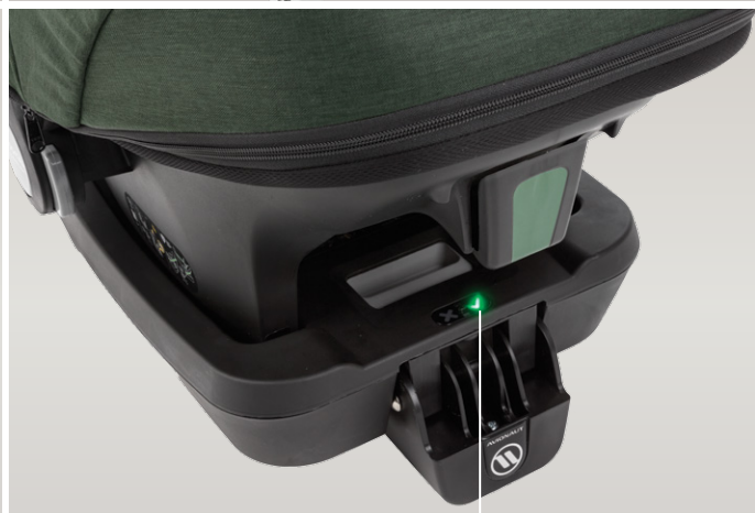
sygnalizacja poprawnego wpięcia