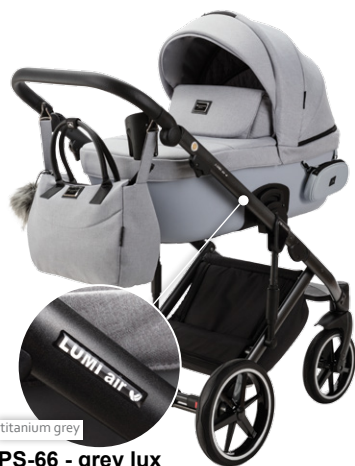
PS-66 - grey lux